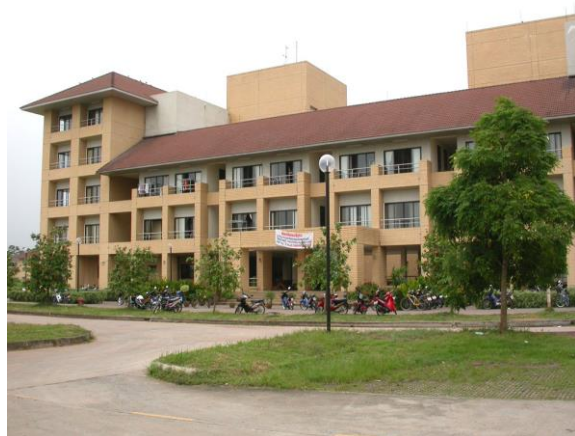
หอพักนักศึกษาหญิง