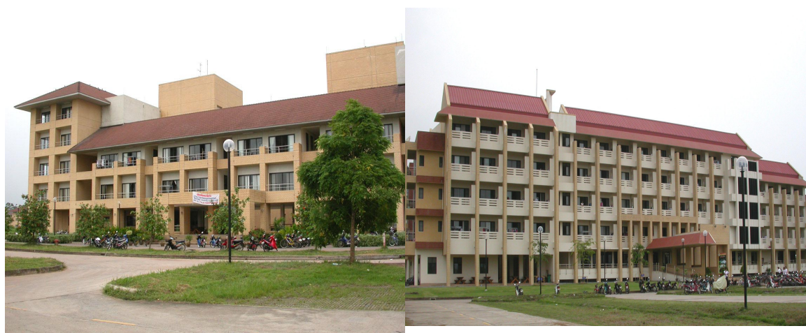
หอพักนักศึกษาหญิง