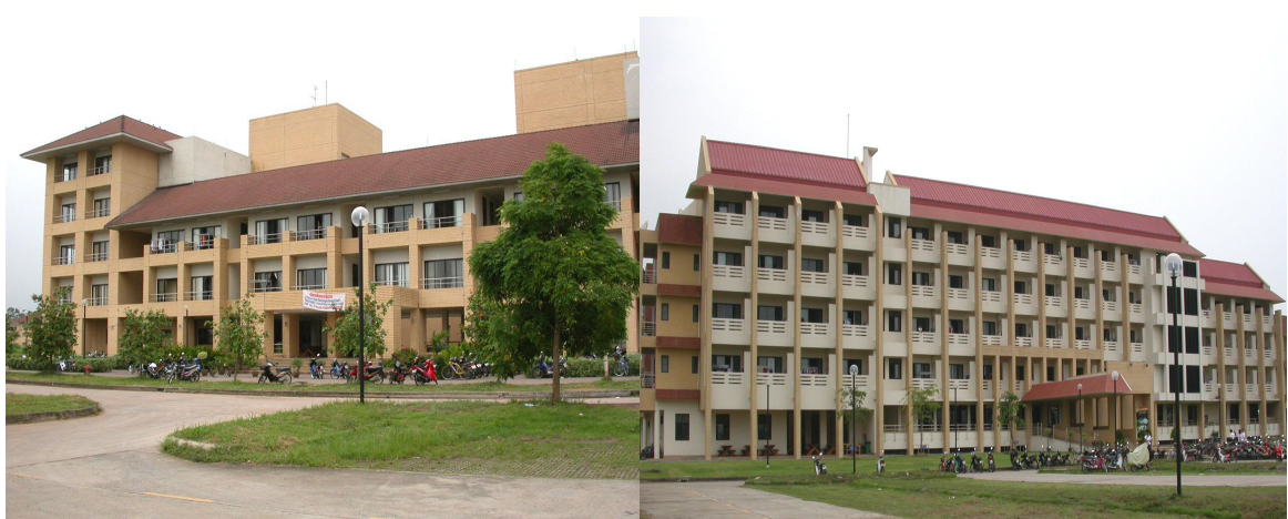
หอพักนักศึกษาชาย