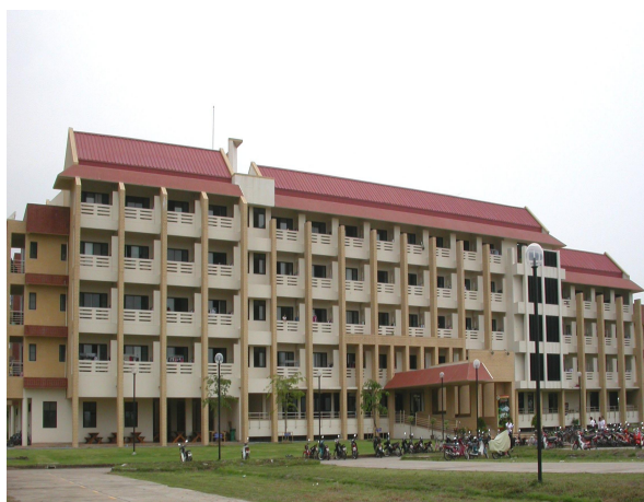
หอพักนักศึกษาหญิง