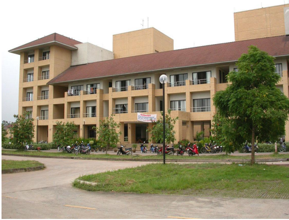
หอพักนักศึกษาชาย