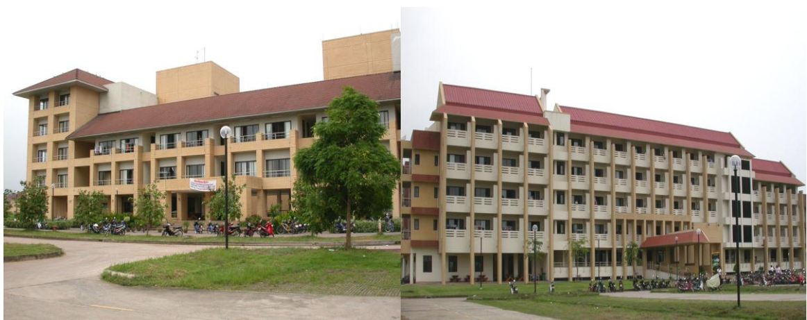
หอพักนักศึกษาชาย