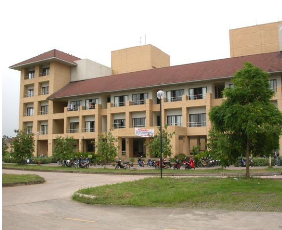
หอพักนักศึกษาหญิง