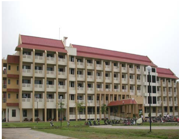
หอพักนักศึกษาหญิง