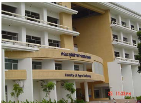
(1) บรรยากาศภายนอกอาคาร