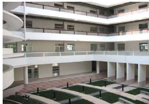
(2) บรรยากาศภายในอาคาร