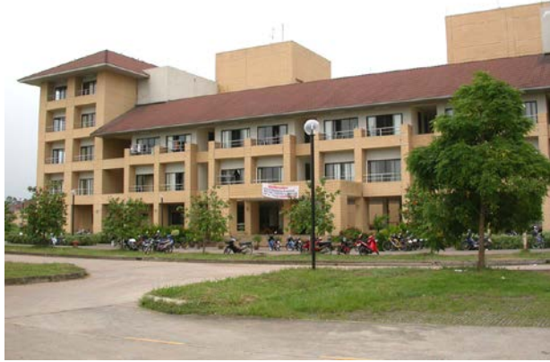
หอพักนักศึกษาชาย